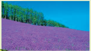
ラベンダー畑を作成予定!